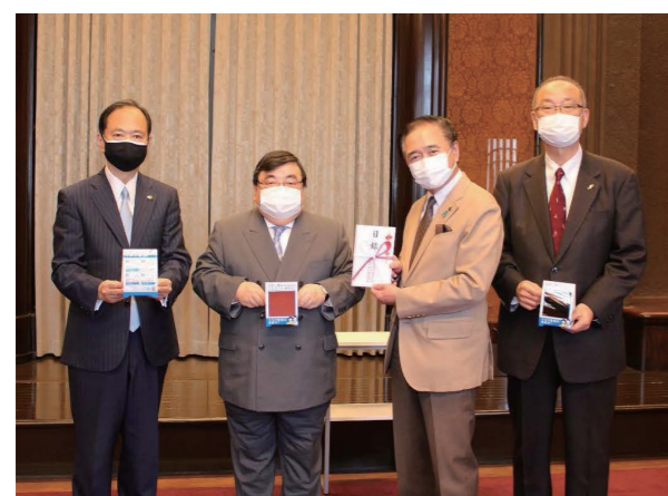
マスク飲食推奨用鏡付きポップ目録贈呈式

さらに神遊協では、神奈川県黒岩祐治知事が感染のまん延防止につながる啓発の呼びかけを県民に対して行うラジオ日本の放送番組を単独で提供し、昨年9月から11月にかけて計73回放送された。