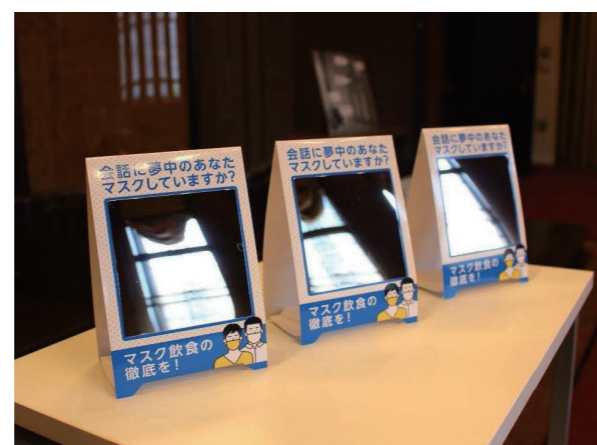
製作されたマスク飲食推奨用鏡付きポップ