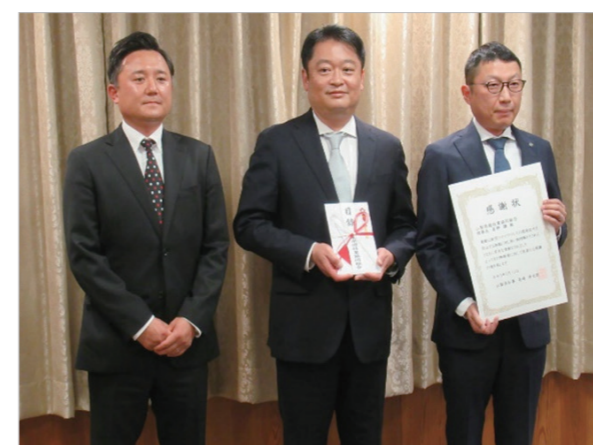
簡易検査キット贈呈式

2020年から続く同組合の新型コロナウイルス感染予防対策への協力に対し、山梨県知事から謝意が伝えられるとともに、知事のTwitterでも発信され、県民に広く周知されることとなった。寄贈した簡易抗原検査キットの利用価値についても報道陣にコメントがあり、新型コロナウイルス感染予防対策のみならず、業界全体が積極的に社会貢献に取り組んでいることが地元テレビ局や地元紙で報道された。