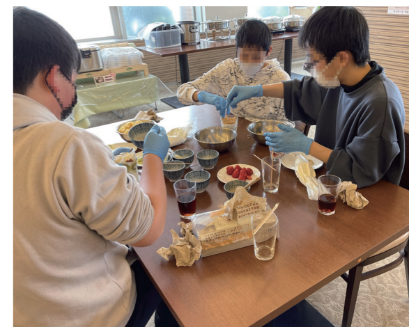
勉強会の翌日にはケーキ作りにトライ