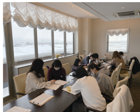
市内のホテルで勉強合宿を実施

子どもたちの将来に格差が生じないようにすることが、地域社会を構成する一員としての責務だと感じています。