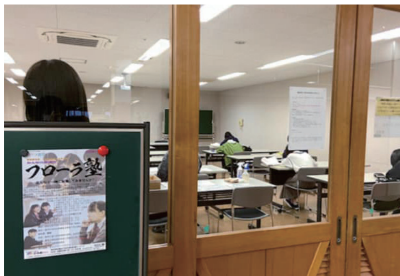
中学3年生を対象とした無料塾を開講

様々な場面での「格差」が問題となっている。経済的なハンディキャップがあっても学びの場や体験の場に参加できる居場所を作ること、子どもの将来に格差が生じることがないよう、子どもたちの成長に寄与することを目的に、子ども食堂とミックスさせた無料塾を開講した。受講生全員が見事、志望校合格を果たした。