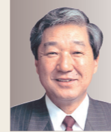
赤松 広隆 前衆議院議員 前衆議院 副議長