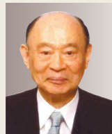
野沢 太三 全国保護司連盟 理事長 元法務大臣