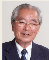
杉浦 正健 弁護士 元法務大臣