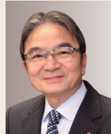
宮田 亮平 前文化庁長官