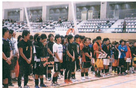
「2013首都圏対決第9回ファイトボール」大会に協賛【写真③】