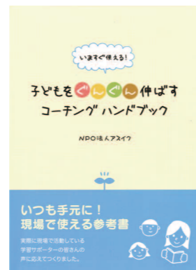
サポートのスキルを向上させるためのハンドブック