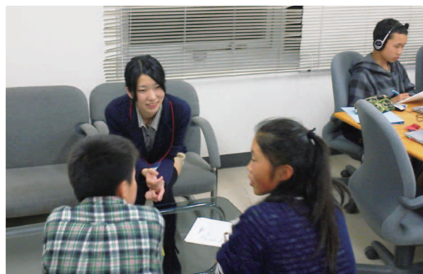
対人サポートによって子どものやる気を引き出す