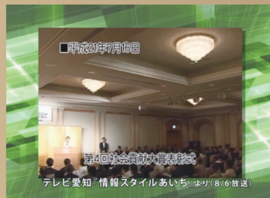
通常総会、贈呈式・表彰式・祝賀パーティーの様子がテレビ愛知「情報スタイルあいち」にて8月6日に放送された