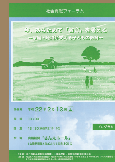
平成22年2月13日に岡山県山陽新聞社「さん太ホール」にて、社会貢献フォーラム「今、あらためて『教育』を考える～家庭・地域が支える子どもの教育～」を開催