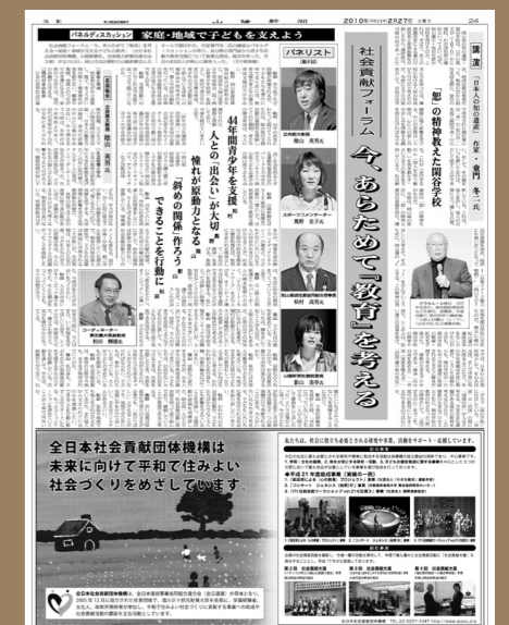
平成22年2月27日(土)付けの山陽新聞で社会貢献フォーラムの様子が報道された