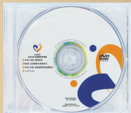
平成21年度の通常総会、贈呈式・表彰式・レセプションのDVDを作成