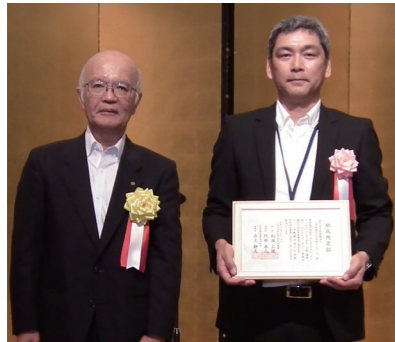
NPO法人 山形創造NPO支援ネットワーク