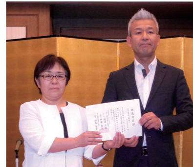
NPO法人 ちいきのなかま