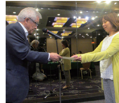
一般社団法人 ReFREL 一般社団法人 ACTくまもと