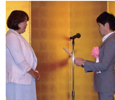
NPO法人 子育て応援ワクワピース