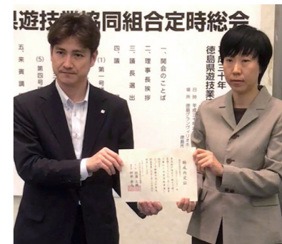
NPO法人 自然スクールエック