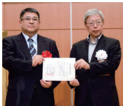
柏の葉サイエンスエデュケーションラボ