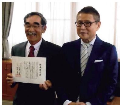
SBSマイホームセンター杯静岡県少年ソフトボール大会実行委員会