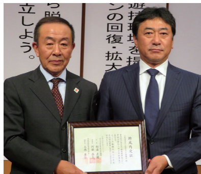
一般社団法人 復興ねぶた協議会