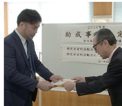
NPO法人 チェンジングライフ NPO法人 JAE