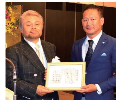
NPO法人 兵庫盲ろう者友の会 NPO法人 アスロン