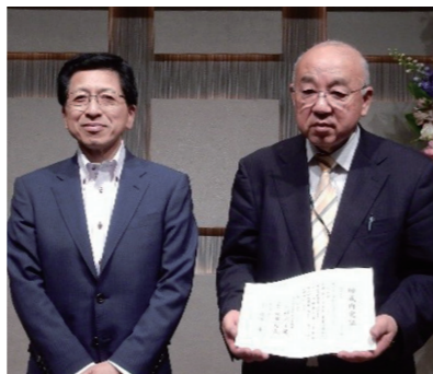
一般社団法人 シャロームいしのまき