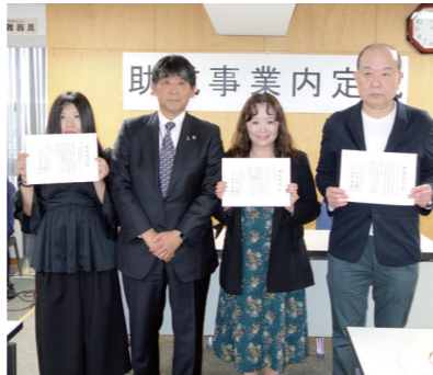
一般財団法人 メンタルケア協会 NPO法人 子ども教育立国プラットフォーム NPO法人 シアタープランニングネットワーク