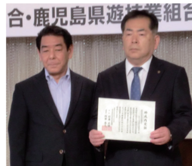
NPO法人 かごしま学習支援協会