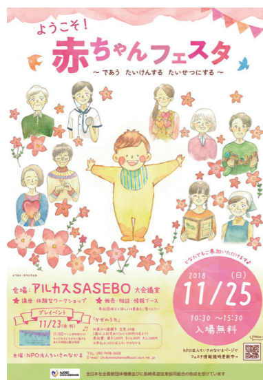
「子育て応援イベント第2回赤ちゃんフェスタ」を告知するチラシ

少子化が社会の成長に及ぼす影響が心配されているが、その対策として子育てしやすい環境を整えることが、まず何よりも優先されなければならない。そのためには、地域社会が全体として子育て家庭を支えていくための仕組みづくりや人材育成が急務である。長崎県佐世保市のNPO法人が産前産後から切れ目ない支援に取り組んでいる。