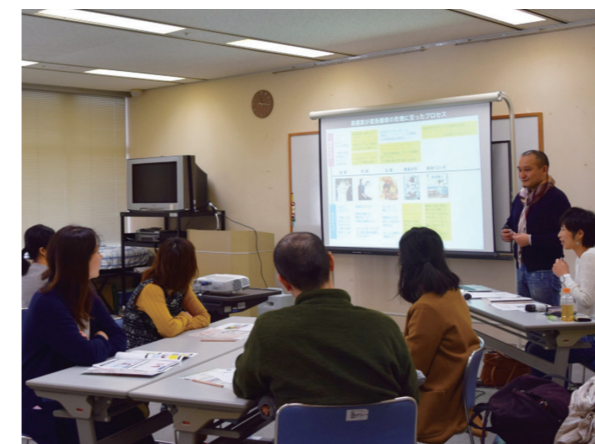
産後の夫婦間のコミュニケーションを円滑にする講座「かぞくの学校」も開催

地域社会が積極的に子育て家庭を支えていくことは、少子化や虐待を防ぐために必要なことだと思ひ助成しました。今後も事業の広がりを期待しています。