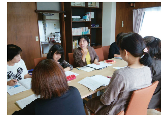
産前産後ケアサポーター養成研修会