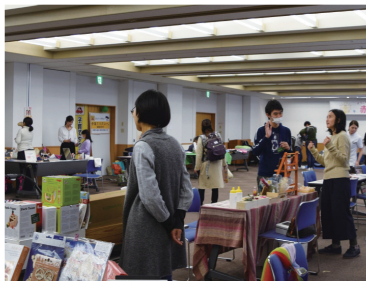
会場では離乳食や絵本の販売、子育て相談会などを開催