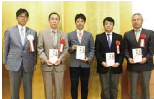
依存問題の相談機関や回復施設に寄付【写真②】