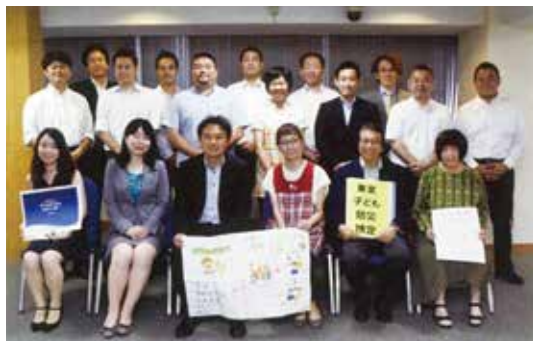
青少年健全育成を支援する団体に助成【写真③】