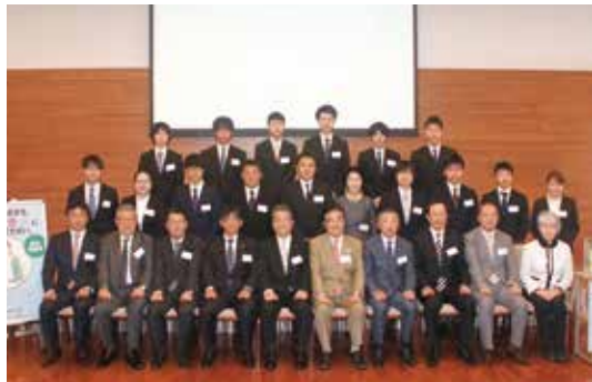
2018年度は22名に給付したpp奨学金【写真①】