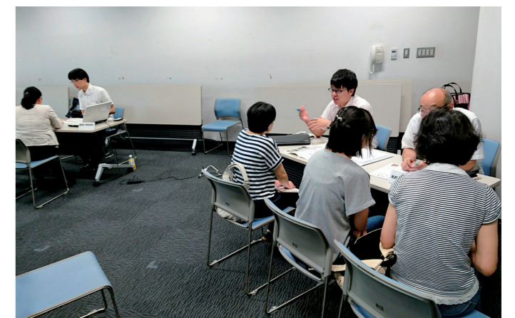
将来に不安や悩みを抱えている子どもや保護者をサポート