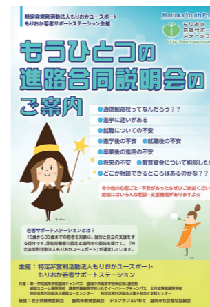
もうひとつの進路合同説明会を告知するチラシ

様々な原因で不登校や引きこもりになった生徒でも、進学や就職・就業といった進路と向き合わざるを得ない。高校中退者もまた同様である。そうした若者たちに必要となる情報を提供し、切れ目のない支援態勢を構築することは、多様な人々が生きることのできる社会をつくるうえでも欠かせない。もりおかユースポートの活動の役割は大きい。