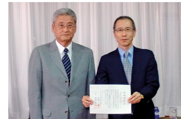
助成団体：京都技術士会理科支援チーム