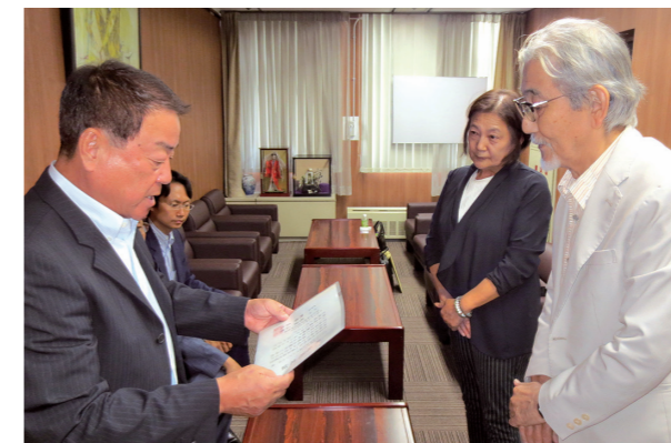
助成団体：NPO法人犬山市民活動支援センターの会