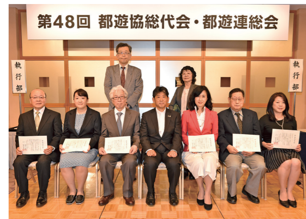
助成団体：公益財団法人日本ピアノ教育連盟、NPO法人子どもと文化のNPO東村山子ども劇場、ビデオレターで結ぶ心の架け橋実行委員会、公益社団法人誕生学協会、NPO法人国際日本語コミュニケーション研究所、NPO法人こどもプロジェクト