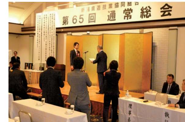
助成団体：NPO法人日印交流を盛り上げる会