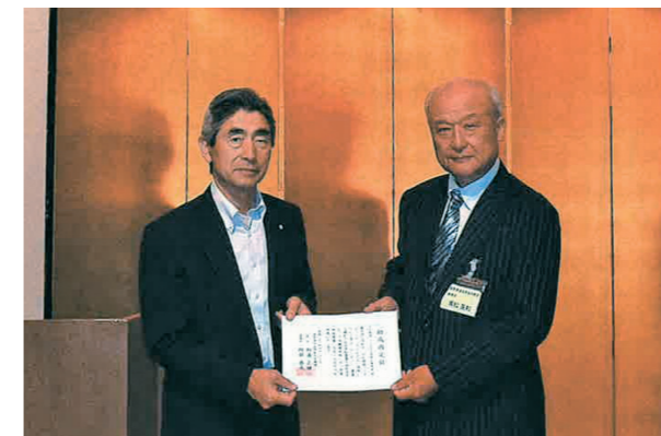
助成団体：信州環境フェア実行委員会事務局