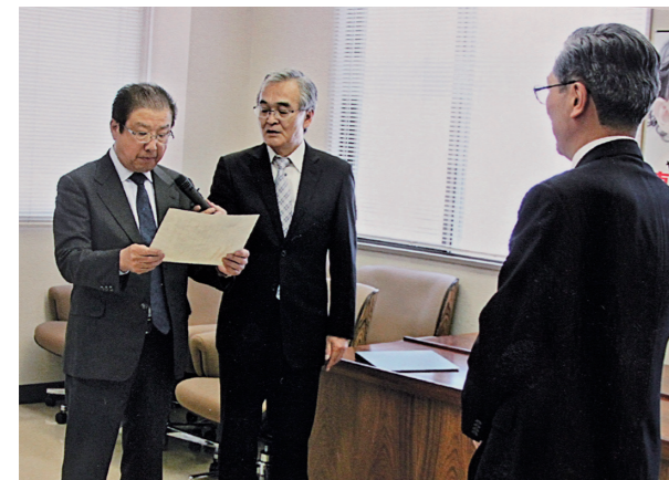
助成団体：「世界遺産 日光の社寺」を次世代の子どもたちへ」キャンペーン実行委員会