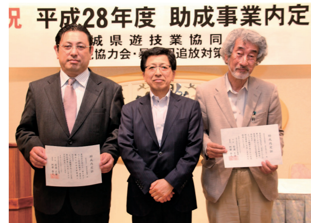
助成団体：一般社団法人環境復興機構、NPO法人森は海の恋人