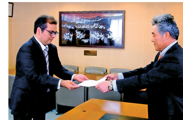
助成団体：一般社団法人ブリッジハートセンター東海