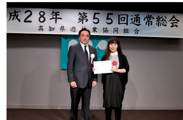
助成団体：NPO法人高知市子ども劇場