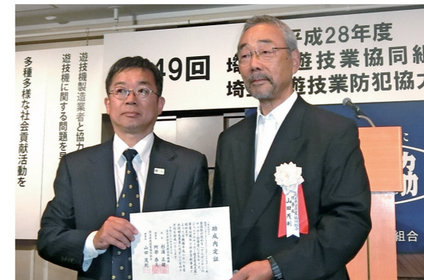
助成団体：一般社団法人飯能インターナショナル・スポーツアカデミー