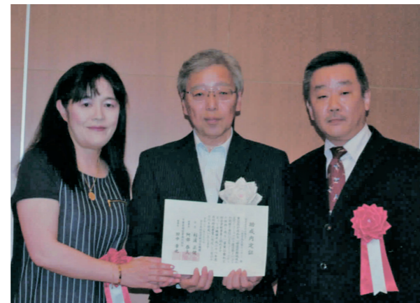
助成団体：NPO法人人財育成支援センター