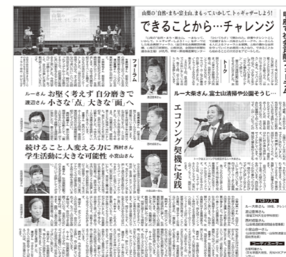
平成27年11月15日に甲府市「かいてらす」で社会貢献フォーラム「山梨の“自然・まち・富士山”～まもっていかして、トゥギャザーしよう!～」を開催。平成27年12月20日付「山梨日日新聞」に掲載された採録記事