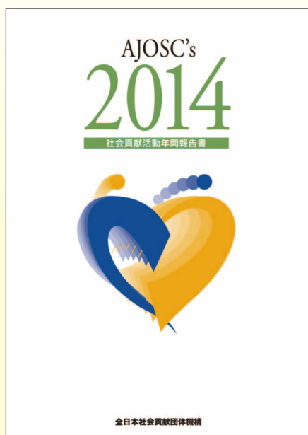
社会貢献活動報告書「AJOSC's 2014」