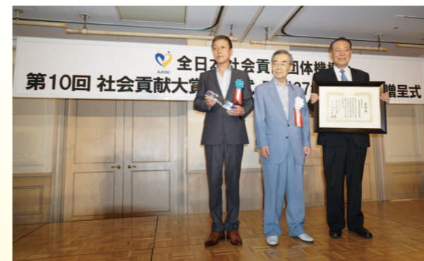
社会貢献大賞・広島県遊技業協同組合