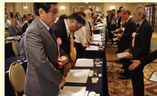
平成27年度助成金贈呈式