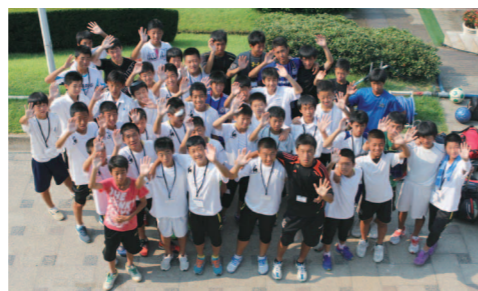
3泊4日の合同合宿で親交を深めた両島の少年たち