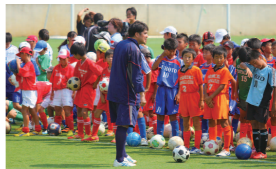
元日本代表 永島昭浩さんによるサッカースクール

5周年ということでグルメ、観光案内、ショッピングなどのブースも開設され、イベント色の強い交流事業となった