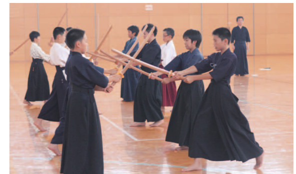
記念イベントの一環として行われた日韓剣道交流大会

今回、参加した子どもたちから寄せられた感想文には、「韓国のサッカーや日本とは違う文化に触れることができ、いい勉強になった」、「韓国の子どもたちから、国を愛していること、誇りに思っていることが伝わってきた」、「一緒にカレーを作るだけでも、文化の違いや英語力の高さに驚かされた」、「言葉や習慣などが違って、気持ちがあれば分かり合える」といった内容が多く見られた。子どもたちは身をもって交流と相互理解の大切さを学んだわけだが、このサッカー交流事業に参加した子どもたちが、将来的に日韓の懸け橋となるような存在に成長していくことを期待したい。