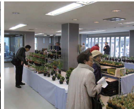
外国人客も訪れる等、伝統園芸フェアへの来場者は年々増加している