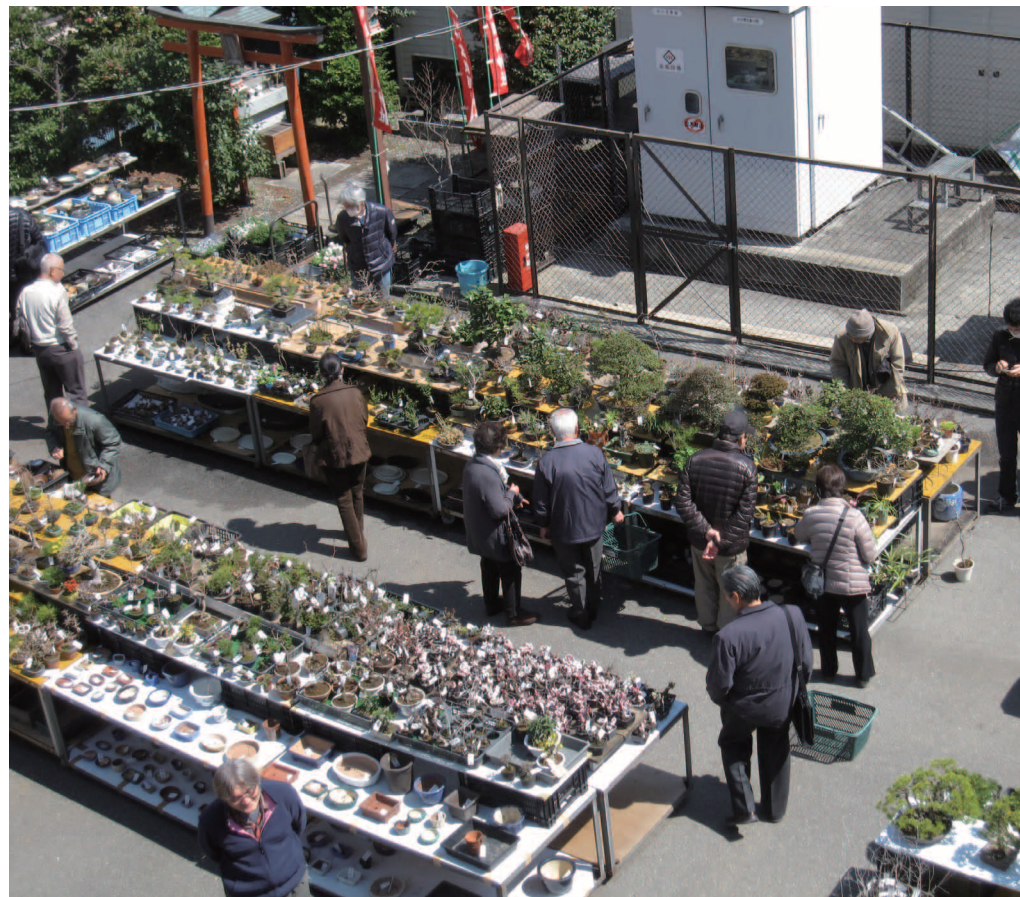
多種多様な植物が一堂に集まる伝統園芸の祭典