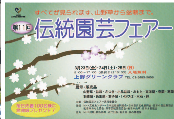
「伝統園芸フェア」展のチラシ