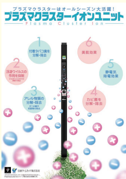
快適なホール環境を実現する PCI

パチンコ業界にとっては、厳しい状況が続いておりますが、レジャー産業が多くの皆様に愛されるよう、今後も環境や省電力といった課題に対応する商品開発に注力しています。