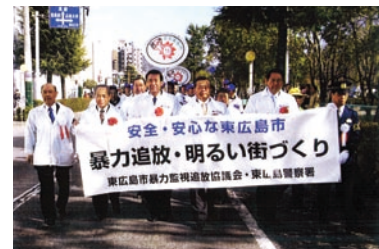
広島県遊技業協同組合「暴力団追放・排除・進出阻止」事業