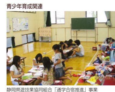
静岡県遊協同組合「通学合宿推進」事業