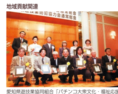
愛知県遊協同組合「パチンコ大衆文化・福祉応援」事業