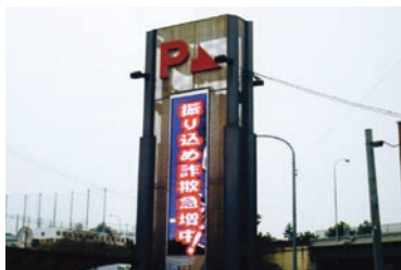
宮城県遊技業協同組合「組合員ホールの電光掲示板による犯罪防止広報活動」事業