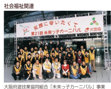
大阪府遊協同組合「未来っ子カーニバル」事業

社会福祉、地域貢献、青少年育成、災害防止・救済・復興支援、交通安全、犯罪防止、暴力団排除、学術・文化支援など、われわれの仲間が、それぞれの地域で、それぞれの実状に合わせて取り組んでいる社会貢献活動は多岐にわたっています。地域社会との共生をめざすうえで、こうした日常の努力の積み重ねは欠かせません。また、継続的な社会貢献活動は業界の地位向上にも寄与しています。