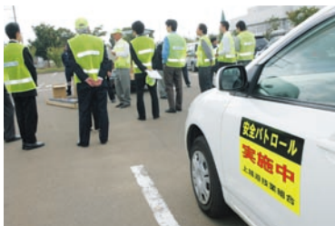
新潟県上越遊技業組合「子ども安全パトロール作戦」事業