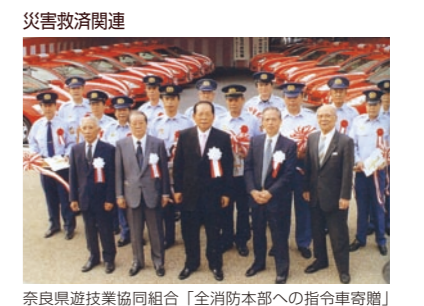
奈良県遊協同組合「全消防本部への指令車寄贈」事業