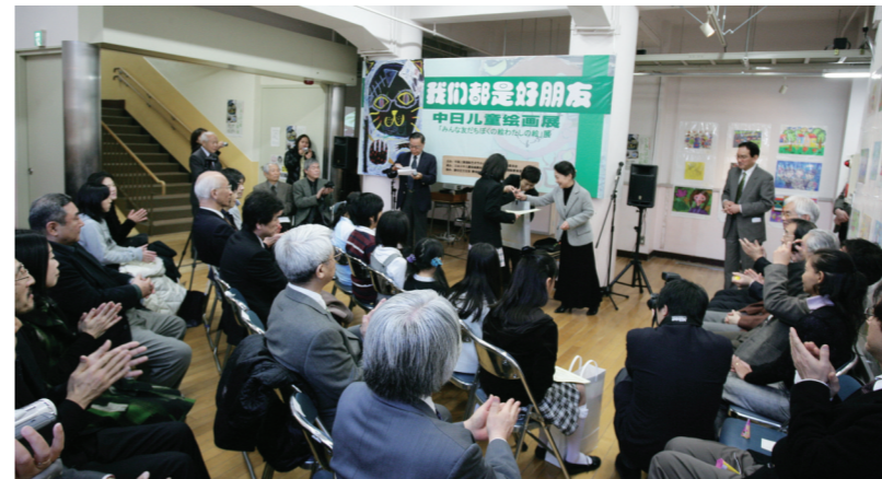
日本で行われた表彰式の様子