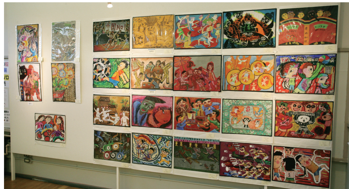
中国(四川省)の子供たちが描いた作品