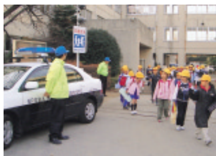
生徒の下校時間に合わせて、小学校校門でパトロールを実施