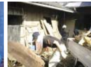
活動のため自前の機材も保有。