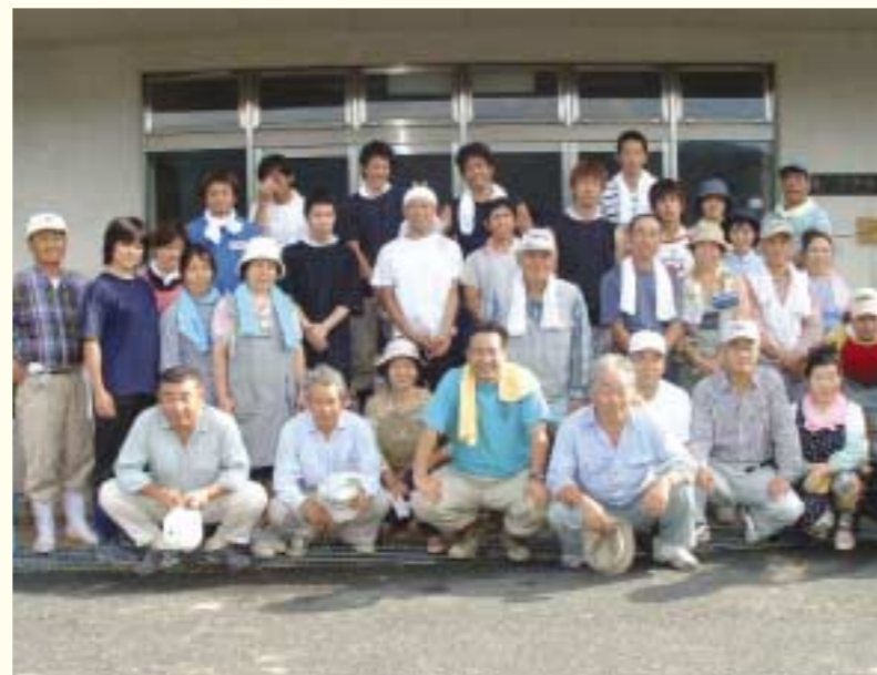
西谷社長は「ボランティアで人や自然に優しい社員が育つ」と語る。活動は日々の接客にも好影響をもたらす。

当然のことを「させていただく」 気持ちで自分達が日頃受けた恩を、自分達が返せる形で返す