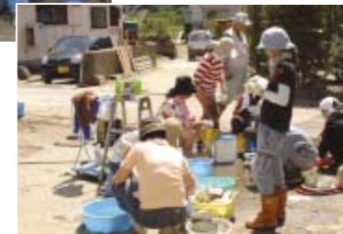
住民の感謝の言葉を励みに復旧作業に打ち込む。