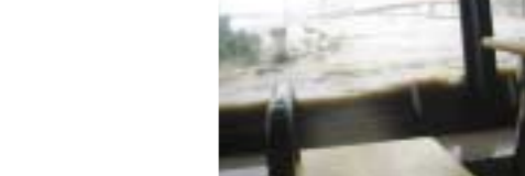
猛威をふるった台風14号