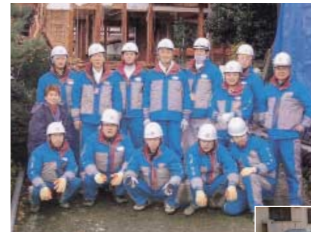
動員力・機動力で災害に即応