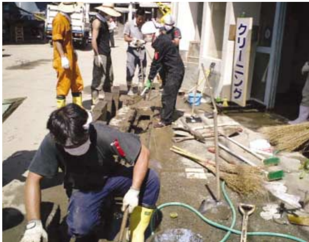
33名の社員が参加した北方町曾木地区（宮崎県延岡市）での復旧活動