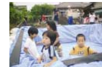
保育園のプール作りなど、災害復旧以外にも地域に貢献する。