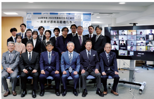
奨学金給付生と役員 [写真①]