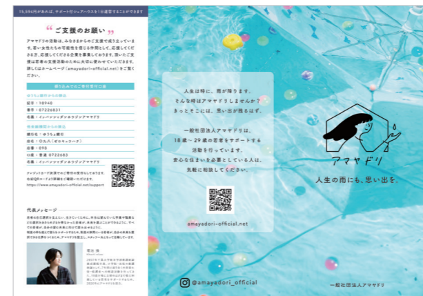
18歳～29歳の孤立・困窮する若者を支援する活動を行っている一般社団法人「アマヤドリ」のリーフレット

従来のシェルターでは利用者の安全を守るという理由のもと、就労・就学ができず、外出や通信機器の使用などが禁じられるケースも見られるが、それがかえって施設利用に対する躊躇や保護の遅れの原因になることもある。同法人ではそうしたことに柔軟に対応することで利用者の安全を守るとともに、自己選択と自己決定が尊重される保護を実現していくことを目指している。