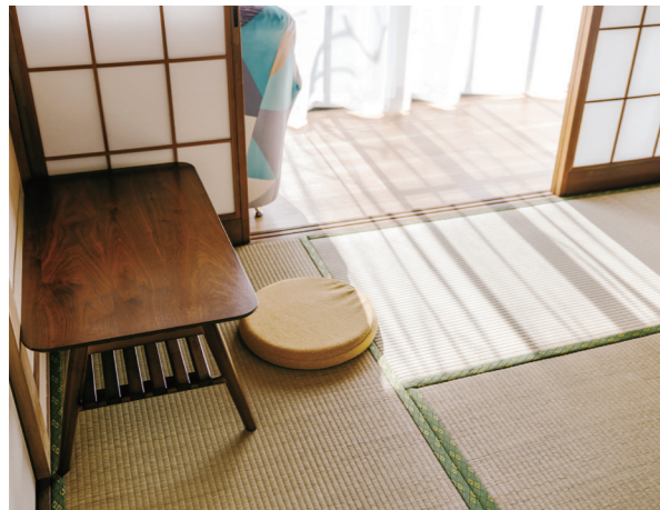
アマヤドリが運営する施設

18歳で成人扱いとなることで得られる権利もあれば、逆に失ってしまう権利もあり、その一つが、児童福祉法や児童虐待防止法などの支援制度を受ける権利である。DV被害者に加え、若年層をはじめ社会的・経済的に困難を抱える女性全般と同伴児童を対象とした一時保護施設（シェルター）の運営を神奈川県を拠点に開始した。