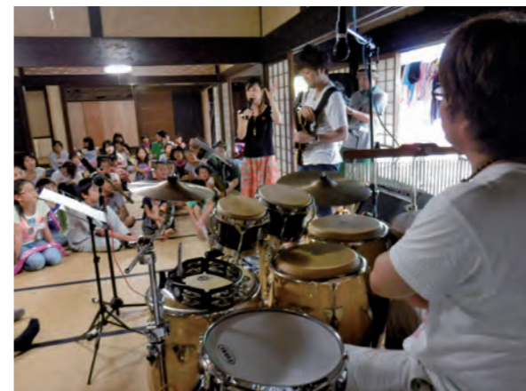
プロ演奏家の奏でる音を聞いて、思い描いたイメージを絵にした