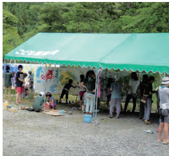
演奏を聴きながら大きなキャンバスに絵を描く