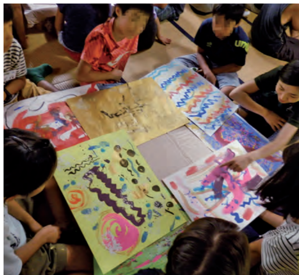
大自然の中、五感に働きかけながら造形活動を行う芸術村アートキャンプ

現在の学校教育から失われがちな情操教育。子どもたちの創造力や想像力を育むことが教育の本質ではないかという問題意識のもと、アートに触れ合える環境を用意しようと、岐阜県各務原市の「マザーハウスing」が始めた「こども芸術村」の活動が10周年を迎えた。アートキャンプの会場となった飛驒の森に、子どもたちの感性がきらめいた。