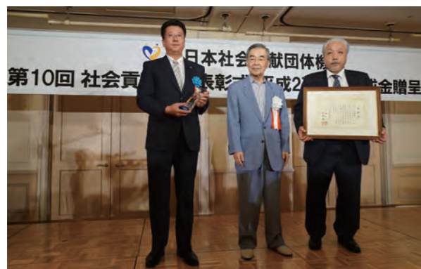
岩手県遊技業協同組合 株式会社アキヤマ