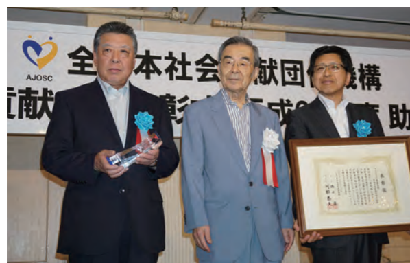
宮城県遊技業協同組合