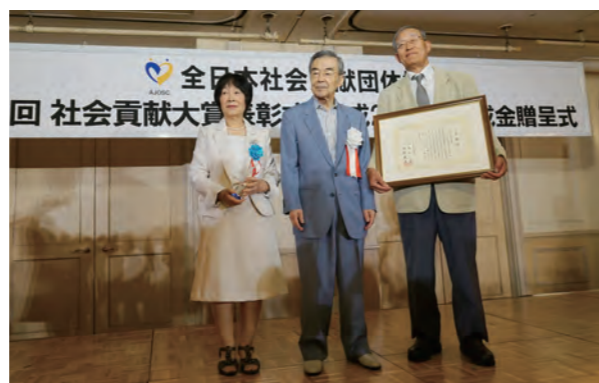
山口県遊技業協同組合 防府遊技場防犯組合