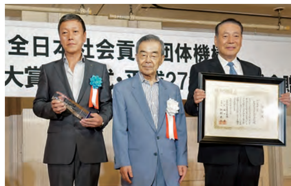
広島県遊技業協同組合