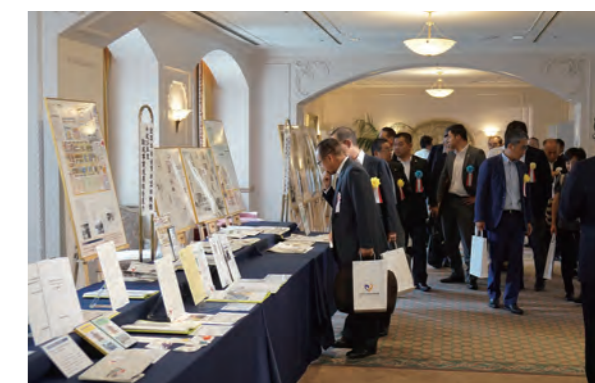
会場入り口に展示された平成26年度の助成団体活動成果物