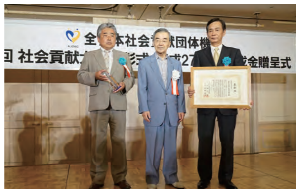
兵庫県遊技業協同組合