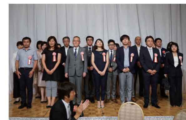
平成27年度の助成団体の各代表者