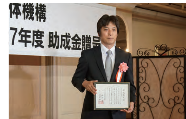
認定特定非営利活動法人リハビリサポート・ネットワーク