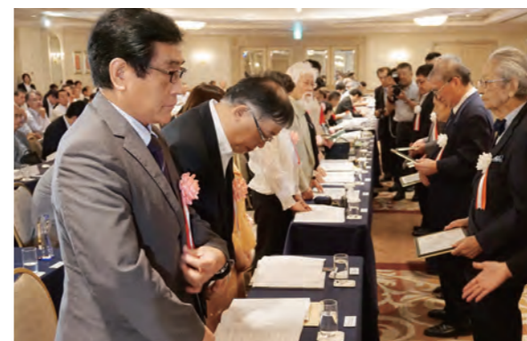
助成認定書の手交