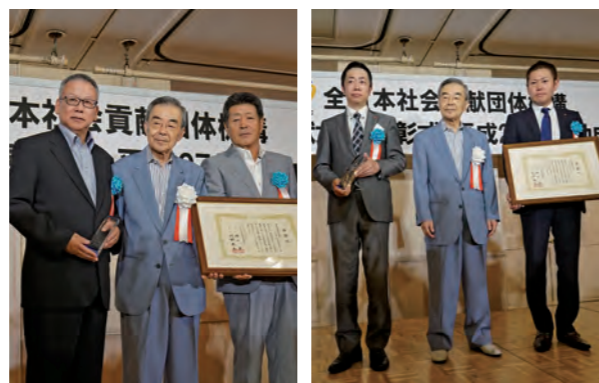
旭川方面遊技事業協同組合 旭川遊技場組合 富山県遊技業協同組合 株式会社ノースランド