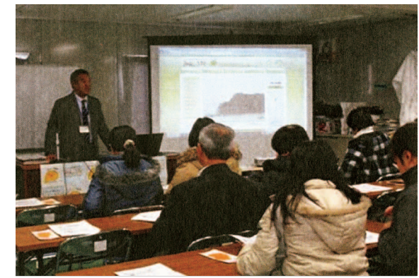
防災・減災に関する啓発事業として行われているみんぷくの防災講話

「当初から支援活動が長期化することはわかっていました。そのなかで活動を継続していくために、改めて支援に携わる人々との間の目的や使命の明確化・共有化、財政基盤やスタッフの能力の強化の必要に迫られていました。そこで、ふくしま連復から派遣されたファシリテーターの方と一緒に、役員、事務局、連携団体の方々が1泊2日の合宿ワークショップを行いました。おかげさまで課題や問題を徹底的に洗い出し、基本方針や活動内容について再確認できました。『孤立する人を生まない地域づくり』という方針のもと、今後3年間の中期ビジョンといったものをまとめることもできました。それが後に、『生活拠点コミュニティ形成事業』という福島県からの委託