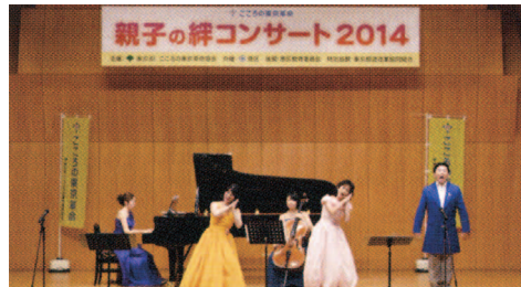
ピアノコンサートの様子 [写真②]