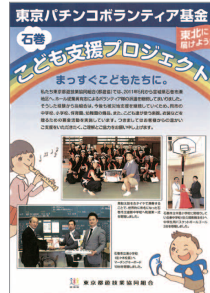
「東京パチンコボランティア基金 石巻・子ども支援プロジェクト」のポスター [写真①]