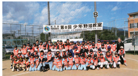
野球教室を開催 [写真③]