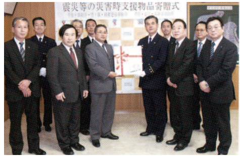
地域の防災対策の一助に、災害用携帯トイレを寄贈【写真②】