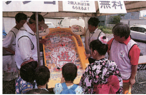
ジャンボパチンコに挑戦する子どもたち【写真①】