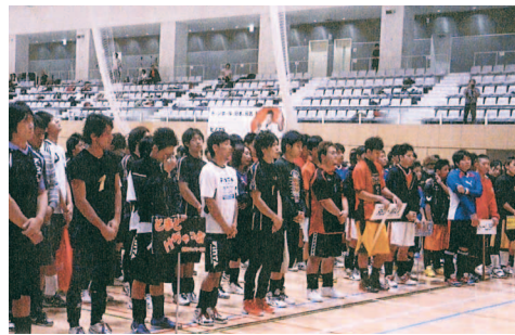
「2013首都圏対決第9回ファイトボール」大会に協賛【写真③】