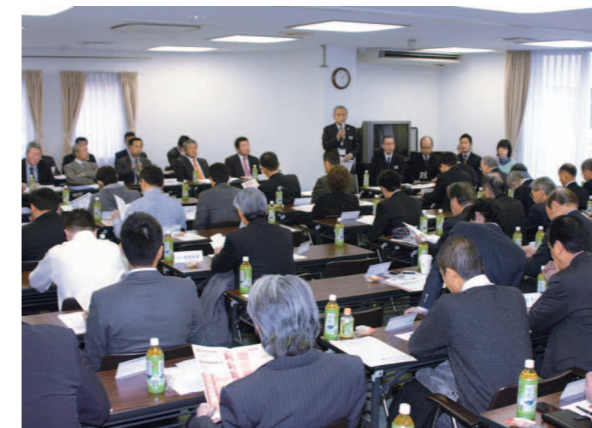
兵庫県健康福祉部による授産商品採用促進説明会の様子

この活動のきっかけは、障がいを持つ人々が働く施設・作業所の手作り商品を専門に扱うショップ「神戸ふれあい工房」（神戸市社会福祉協議会・兵庫セルフセンター運営）の商品カタログを渡され、活用を依頼されたことで、青年部会、神戸市社協、ふれあい工房に、賞品類をホールに卸す（株）兵栄を加えて協議を続け、青年部会員の各ホールを中心に端玉賞品として授産商品を採用していこうと始まったものである。（株）兵栄は賞品類をホールに搬送する際に、ボランティアとして注文のあった授産商品と一緒に運ぶことに協力している。2008年からは青年部会のこの活動に兵遊協も協力し、組合全体として取り組んでいるが、それが好結果をもたらし、スタート当初は13ホールだった協力ホールが、現在では41ホールと3倍強に増え、それに伴うふれあい工房の売り上げも当初の123万円から、昨年は約545万円と4倍以上に増加し、工房全体の年間売り上げの約1/4を占めるまでになったという。