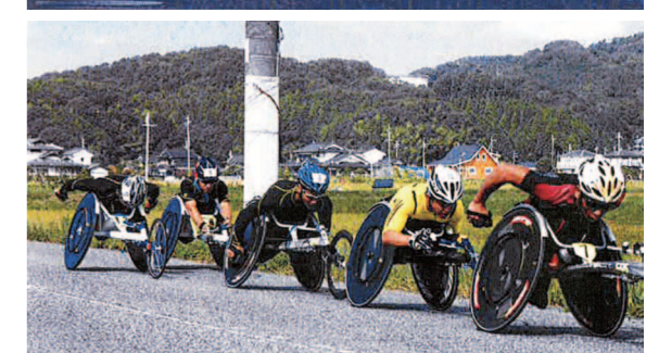
毎年、盛大に行われる「全国車いすマラソン大会」を支援