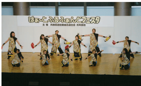
障がい者と健常者のふれあい交流として披露されたダンス