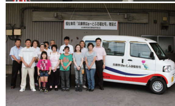
2003年から続けられている福祉団体への車両の寄贈事業