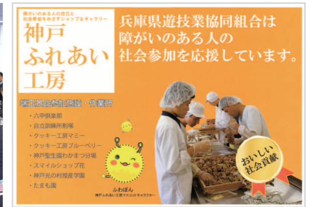
授産施設の商品を扱う神戸ふれあい工房を支援している兵遊協

こうした実績を背景に、昨年、「兵遊協／障害者ぬくもり応援団」は立ち上がったが、今後の具体的な活動や目標としては、端玉賞品への授産商品のさらなる導入を促進することはもちろん、これまで神戸ふれあい工房を通じて神戸市内にある障がい者就労施設や小規模作業所に限られていた仕入れ先を、兵庫県下全域にある施設に拡大していくことを掲げている。すでに豊岡市や川西市にある施設からの仕入れが始まっているほか、今年度は姫路市や加古川市にある施設からも授産商品を仕入れる