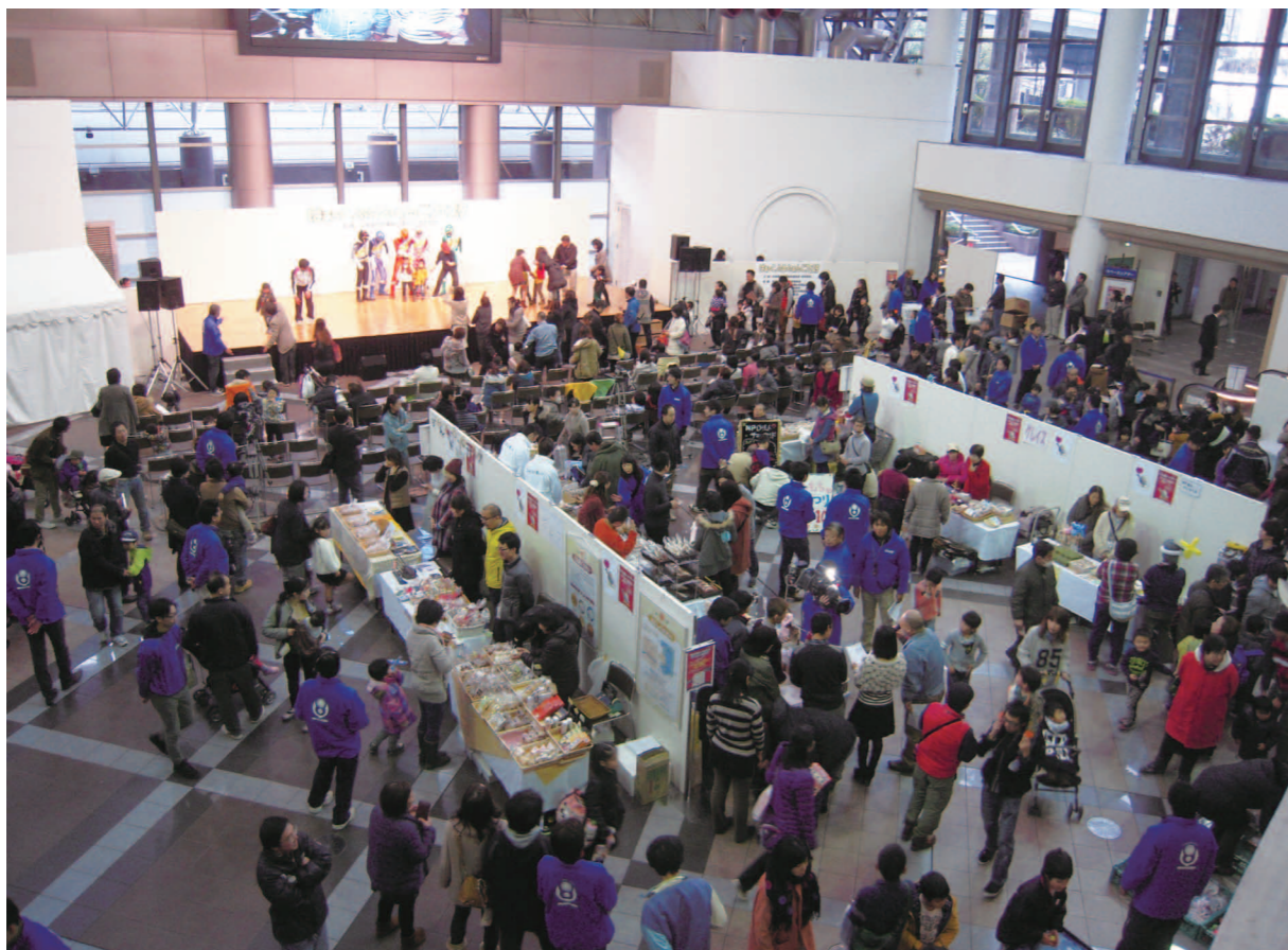
「第5回はあ〜とふるふあんどフェスタ」の様子。会場中央に障がい者施設の販売ブースが設けられた