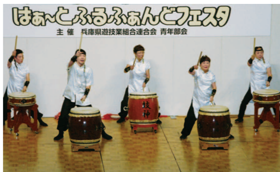
ろうあ団体による力強い太鼓の披露