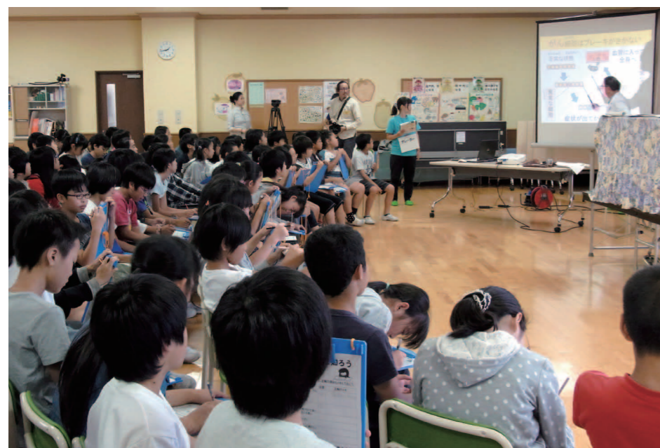
荒川区が区内の小学校で実践している「がん予防出前授業」の様子（荒川区立沙入小学校にて）

「自治体のがん検診の実施の仕方やがん対策への取り組みには、温度差やばらつきがあるのが現状です。さらに国の次期基本計画に向けては、がんの教育をどのように扱い、実施主体をどこにするべきか、多くの自治体が戸惑っています。一方で、すでながん教育に先進的に取り組み成果を上げている自治体もあり、これらの事例は、全国の自治体が模索するがん教育への取り組みに対して