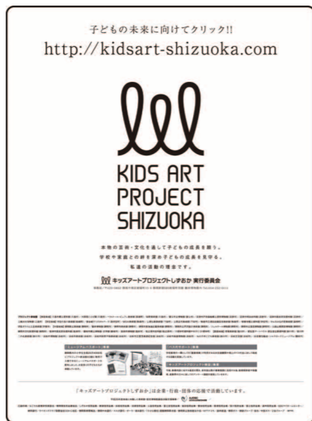
静岡新聞に掲載されたプロジェクトの告知

2013年に配布されたミュージアム・パスポート。受付で押してもらったスタンプを集めると記念品がもらえる仕組み