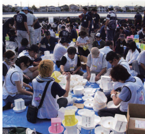
灯笼づくりを手伝う組合員 [写真①]