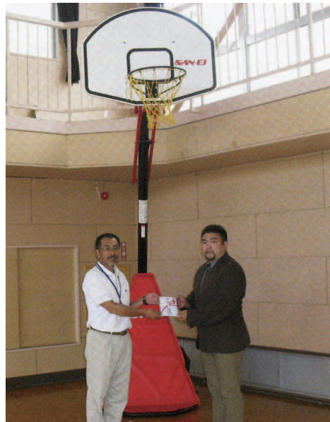
バスケットゴールを寄贈 [写真②]