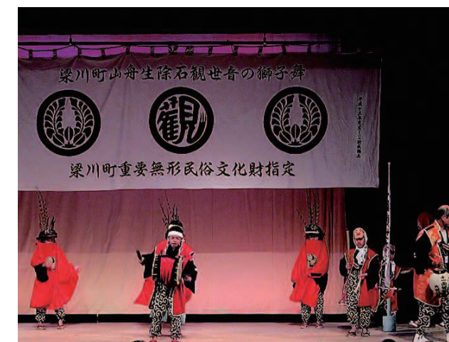
福島県梁川町で400年前から伝わる「除石の獅子舞」

「子どもたちがやらされているという意識では、本当の意味での継承とは言えません。彼らが主体的に関われるもの、さらには自らが身につけた芸能を相互に教え合う