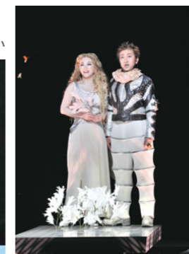
歌声がいつでも頭に響いて 子どもたちには忘れられない 1日になっただろう