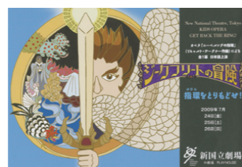
当日配布されたプログラム。 TVゲームの解説本のような デザインで工夫がされている

「少しでも多くの子どもたちを本物の舞台芸術に触れさせたい」それを目的として始まった新国立劇場の「こどものためのオペラ劇場」。回を重ねる毎にファンが広がっている。新たな企画も探りながら、2009年は7月24日～26日の日程で開催された。