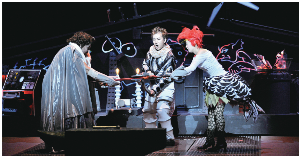
劇は最初から最後まで子どもたちが楽しめる内容となっている