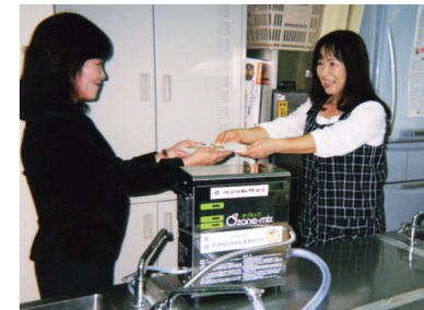
こじか保育園にはオゾン水生成装置が贈られた