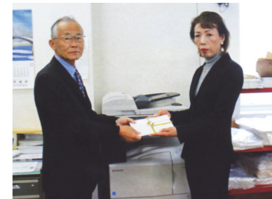
山水会にコピー機が贈られた