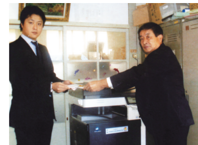
ひまわり作業所にコピー機が贈られた

また、福祉施設に空き缶圧縮機も贈った。この施設では協力者が地域から回収した空き缶を分別・圧縮して専門の業者に買い取ってもらっているのだが、これまでは足で踏んで圧縮していたため、1時間で100個程度しか処理できずにいた。圧縮機を使うと、1時間に2000個もの処理ができるという。