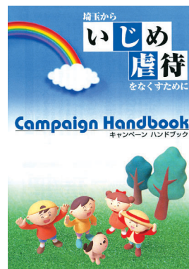
配布されたハンドブック