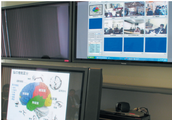
センター側のモニターには参加者の様子が表示される