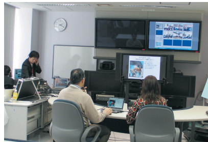
放送中のセンターの様子